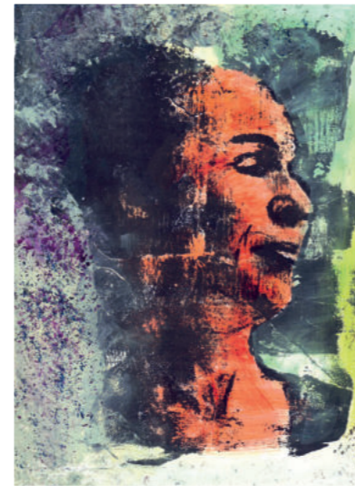
A.P. 49 Jahre

Ich möchte mit Kunst Frieden schaffen und anderen was Gutes tun.