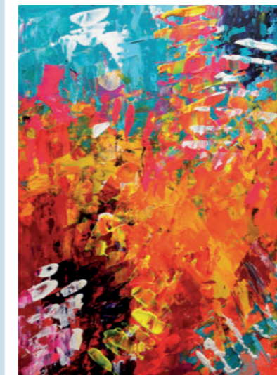
Kevin S. 30 Jahre

Ich möchte mir lange eine gute Lebensqualität erhalten.