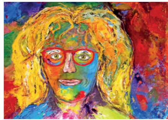
Stiftante 49 Jahre