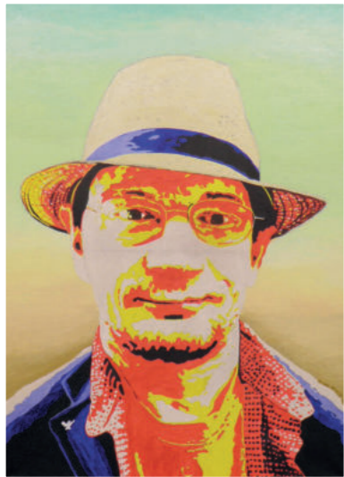
OCRAM 48 Jahre