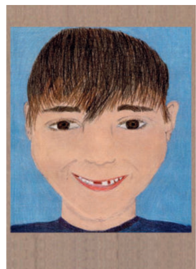
TM 9 Jahre

Ich möchte steinalt werden, ohne nennenswerte Verschlechterung. Außerdem scheint bei mir fast immer die Sonne und das soll auch unbedingt so bleiben.