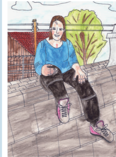
SU 34 Jahre

Ich wünsche mir, dass die Forschung endlich erfolgreiche, neue Therapien findet.