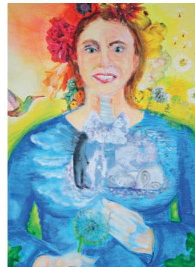
PW 54 Jahre

Ich möchte Künstlerin werden und mein eigenes Atelier haben!